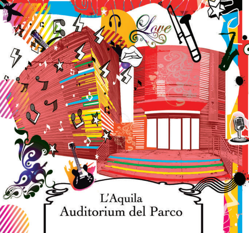
L'Aquila Auditorium del Parco