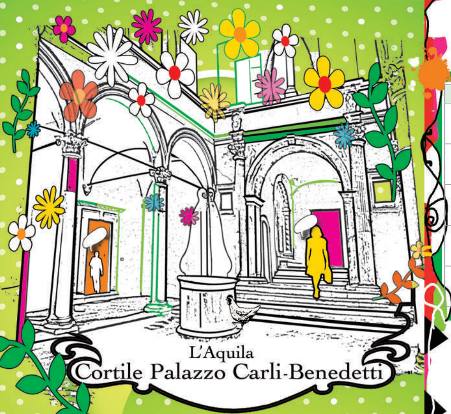
L'Aquila Cortile Palazzo Carli-Benedetti