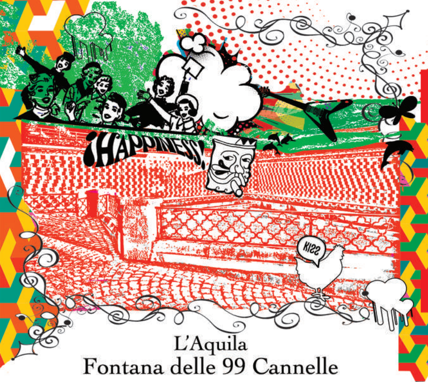
L'Aquila Fontana delle 99 Cannelle