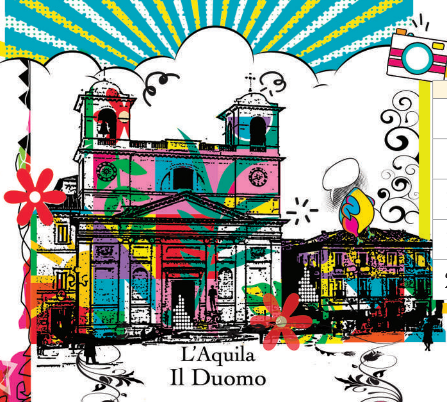
L'Aquila Il Duomo