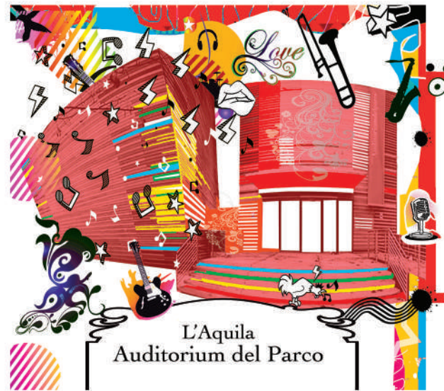
L'Aquila Auditorium del Parco

Fronteggia l'opera a terra di Michelangelo Pistoletto Il Terzo Paradiso, "connessione equilibrata tra l'artificio e la natura" (cit.).